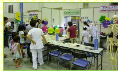
8/23～24 キッズジョブの様子