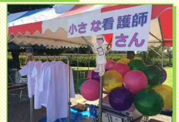
9/28 勤労者サービスセンター フェスティバルの様子