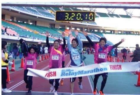
リレーマラソンゴール♪ 前年のタイムを大幅に更新しました(^)v